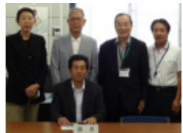
陸前高田市仮市庁舎 議長室にて