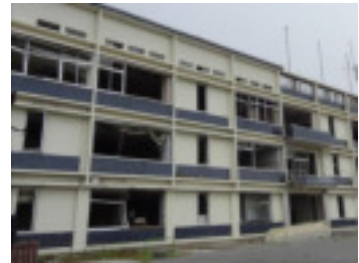
津波の高さは屋上まで達しました

被災地を視察後、交流プログラムの場所となる高田高校第2グラウンド仮設住宅（岩手県陸前高田市高田町）を訪問。